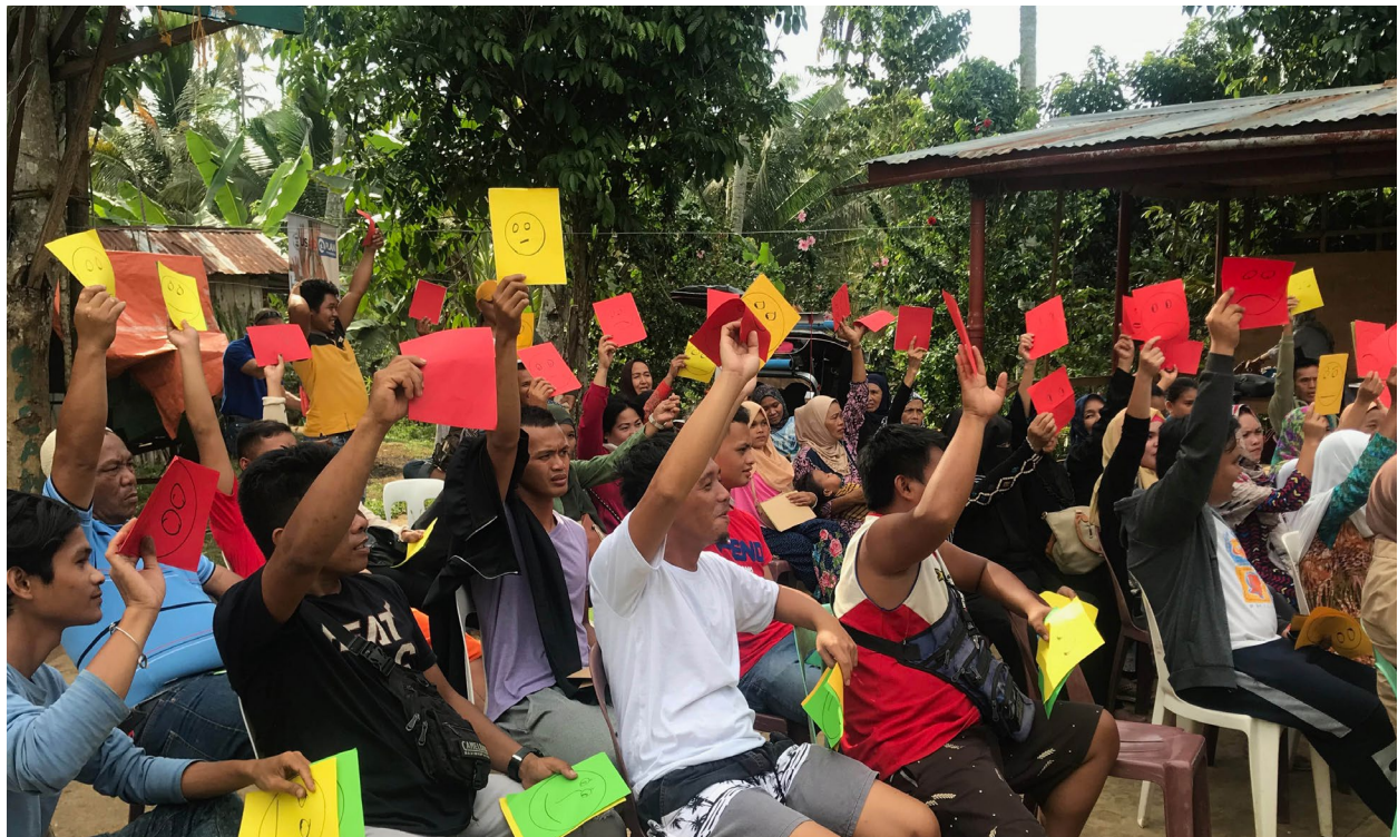
Plan International (2020).

Vous trouverez ci-dessous un modèle de carte de pointage. Contextualisez-le pour respecter les échéances convenues ou pour ajouter d'autres normes que les communautés souhaitent appliquer. Adapté de la Boîte à outils sur la qualité, l'impact et la redevabilité du programme de Plan International.